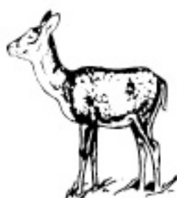
6 - 8 ani