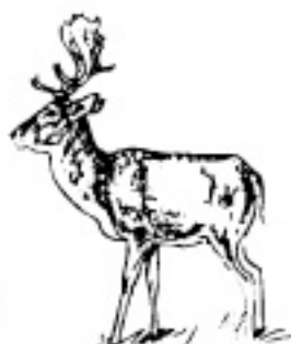
6 - 8 ani