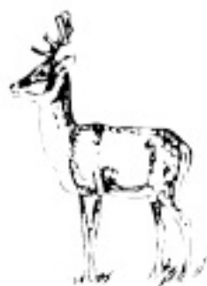
2 - 4 ani