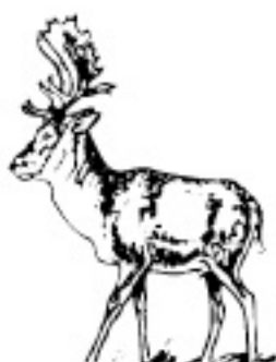
10 - 12 ani