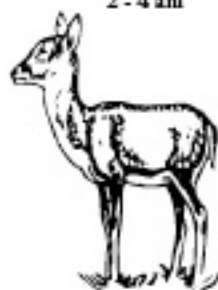
2 - 4 ani