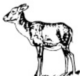
10 - 12 ani